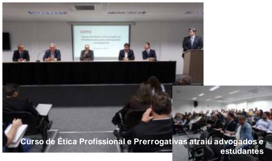
Curso de Ética Profissional e Prerrogativas atraiu advogados e estudantes

No último trimestre foram ministradas palestras sobre questões atuais do Direito. Em abril, advogados, estagiários e estudantes de Direitos assistiram e debateram com os palestrantes temas como os aspectos e reflexos jurídicos do Marco Civil da Internet, Audiência de Custódia, e sobre o Recurso Extraordinário 603616 que teve repercussão geral reconhecida pelo STF com a tese de que a entrada forçada em domicílio sem mandado judicial só é lícita, mesmo em período noturno, quando amparada em fundadas razões, devidamente justificadas, e que indiquem