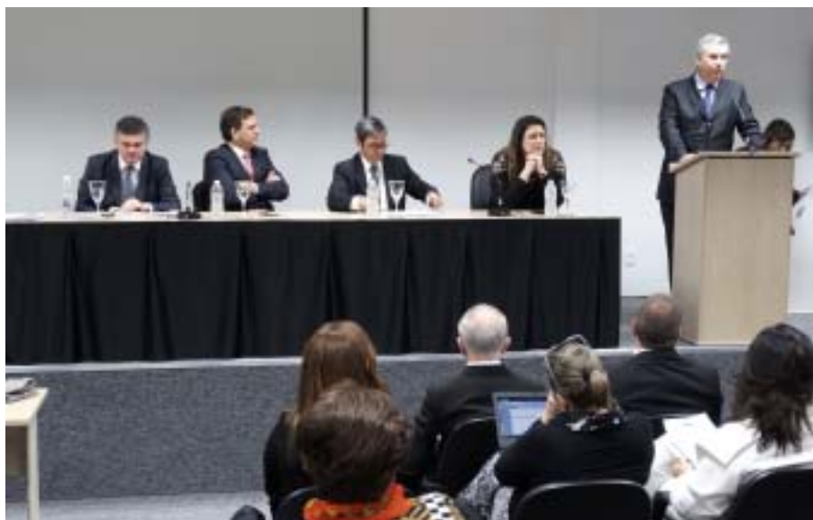
Dirigentes da Secional e da diretoria da Subseção participaram da sessão

A OAB paulista é a única no país que possui a Turma Deontológica dentro da estrutura do Tribunal de Ética e Disciplina. "As decisões da primeira turma tem balizado o posicionamento de advogados de todo o Brasil, é a única seccional do país que tem uma turma deontológica e agora estamos implementando um dos motes dessa gestão que é a interiorização das tur-