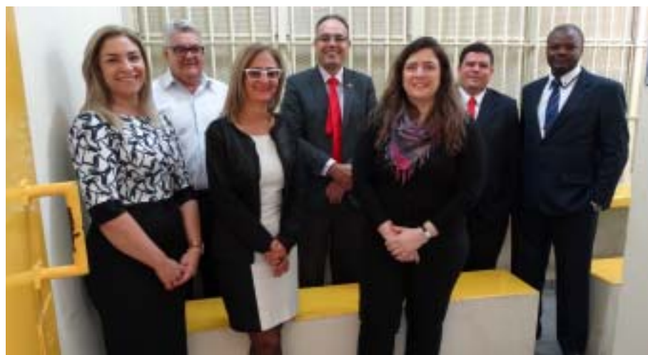
O diretor do CDP recebeu os advogados em visita à unidade